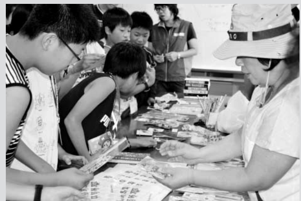
キャンプではバザーもあるよ。どれにしようかな？