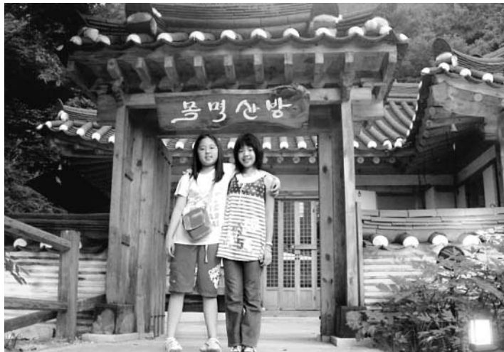
お別れの前日。話す言葉は違っても、心はしっかり通じ合えた。

アメリカに行ったときは、生まれ変わったら住みたいと思ったけど、韓国は「将来住みたいところ」と思った。 (大学2年 女子)