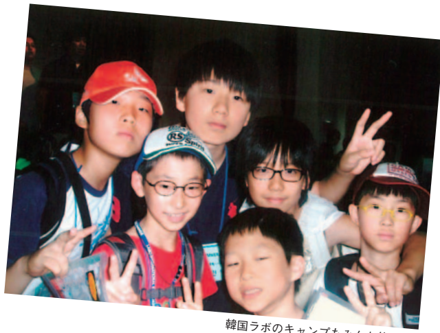
韓国ラボのキャンプもみんな仲良し。