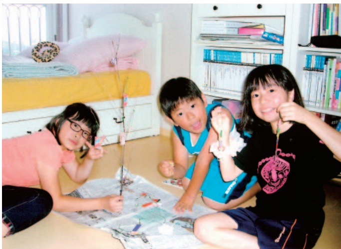
日本から持って行ったセタ（たなばた）かざりをホスト達と一緒に作ったよ。

次の時代は両国の人々にとって、今まで以上に協調と協力が求められるでしょう。そして、青少年年代にホームステイ交流を通じての友人を持つことはそのための何よりの財産となるでしょう。